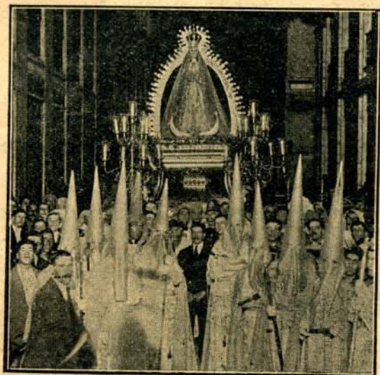
MARÍA SANTÍSIMA DE LA CONCEPCIÓN DOLOROSA