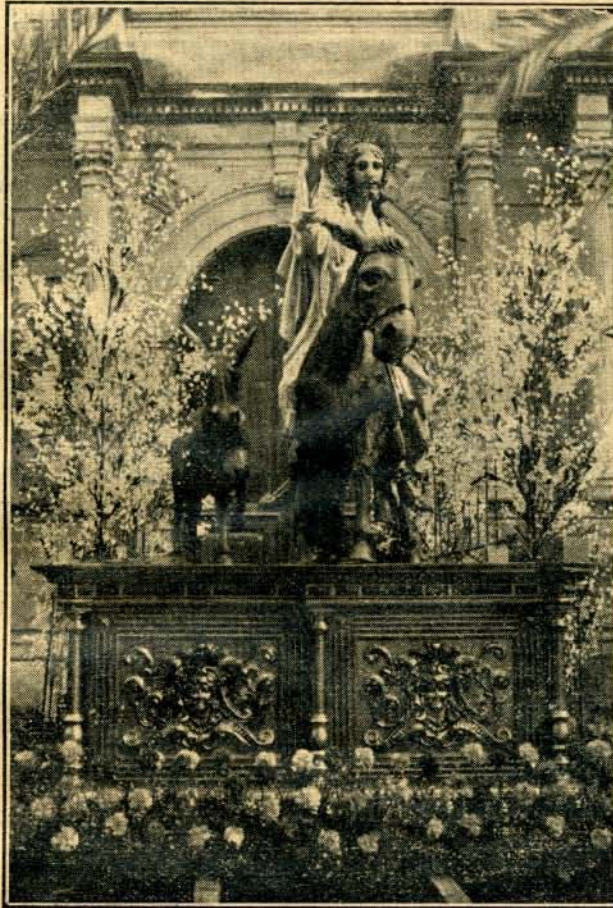
NUESTRO PADRE JESÚS A SU ENTRADA EN JERUSALÉN

brará la misa solemne y después de la Epístola se cantará la Pasión, según el texto de San Marcos.