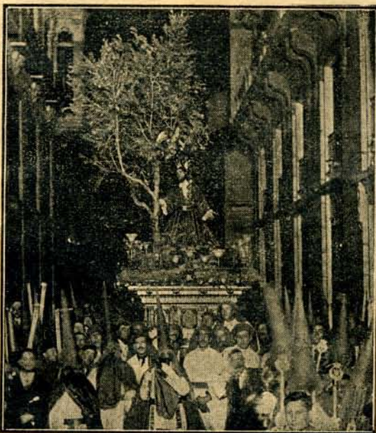
NUESTRO PADRE JESÚS ORANDO EN EL HUERTO