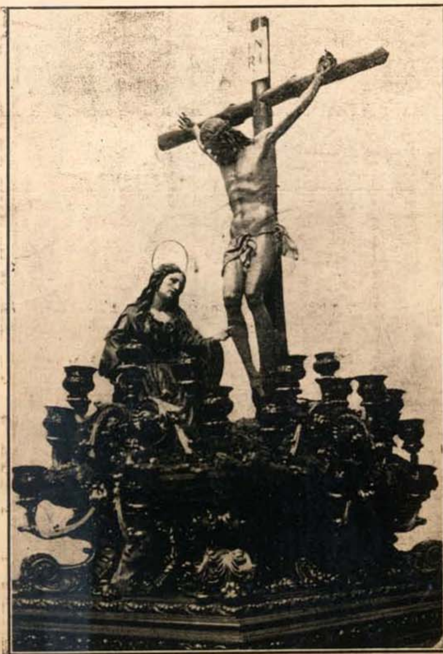
Santísimo Cristo de la Buena Muerte. Obra del genial Pedro de Mena