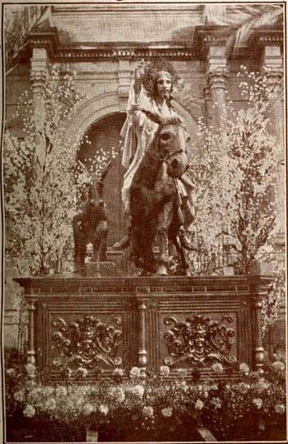
Nuestro Padre Jesús a su entrada en Jerusalén.