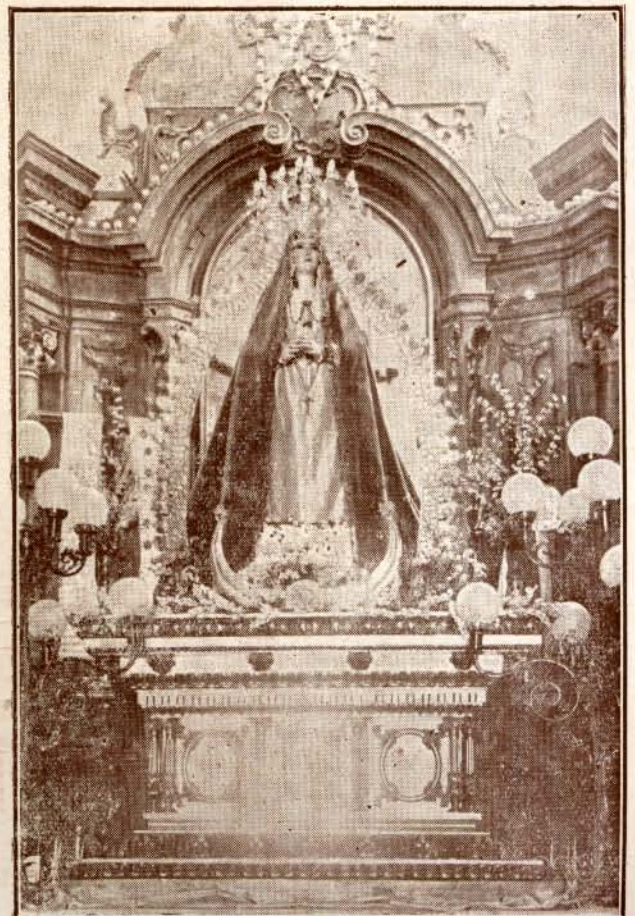
María Santísima de la Concepción Dolorosa.