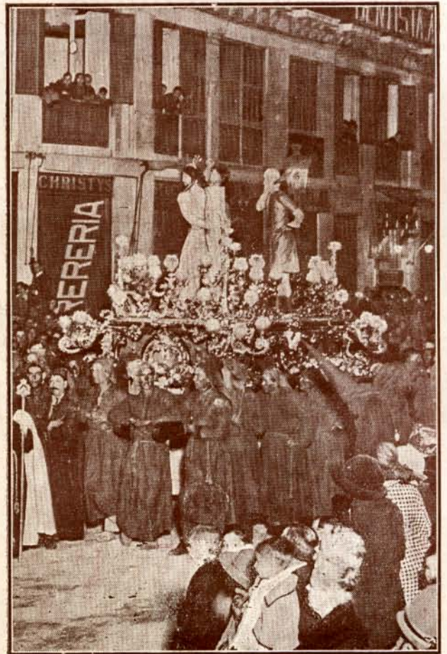
Nuestro Padre Jesús de Azotes y Columna